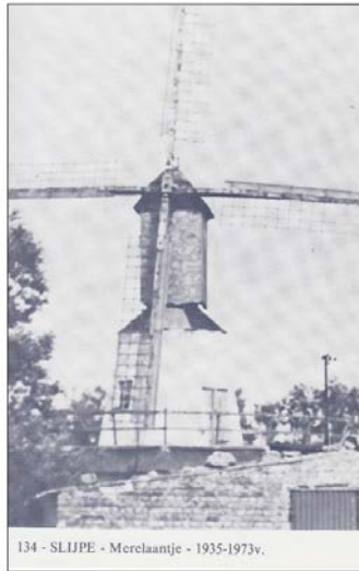
134 - SLIJPE - Merelaantje - 1935-1973v.